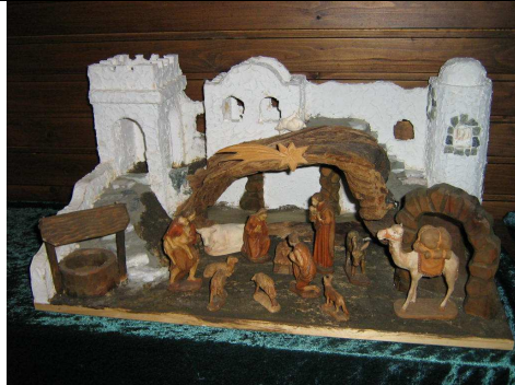
Eine Krippe vom Schnitzer Gerhard Fucac aus Hadersfeld

Frohe Weihnachten und viel Glück im Jahr 2011