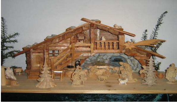
Eine Krippe des Krippen - Schnitzers aus Hadersfeld

Frohe Weihnachten und viel Glück im Jahr 2020